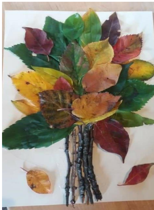
جدول شماره ۲. نتایج ارزشیابی تعیین میزان تسلط نسبی ثانویه گروه ها تصویر شماره ۲: نمونه کاردستی دانش آموزان

در مرحله بعد به هر یک از گروه های دهگانه موظف شده اند با همکاری هم یک کاردستی خلاقانه با موضوع محیط زیست بسازند. انتخاب محتوا و فرم ارایه آزاد بود و دانش آموزان موظف شدند با بحث و تبادل و نظر باهم در گروه های کلاسی خود با کمک معلم و کتاب درسی، آنها را متناسب با موضوع گزینش کرده و ارایه نمایند. (تصویر شماره ۲) سپس برگه های ارزشیابی مجدداً به صورت صادقی میان آنان پخش شد تا میزان تسلط نسبی آنان مشخص شود.